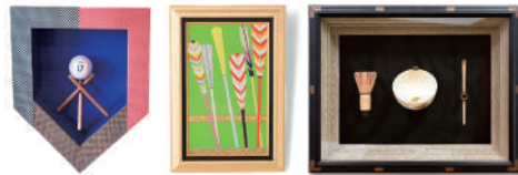
【額装例】 上段：思い出の腕時計 下段 左：野球ボール 中：帯 右：茶道具