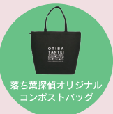
落ち葉探偵オリジナル コンポストバッグ