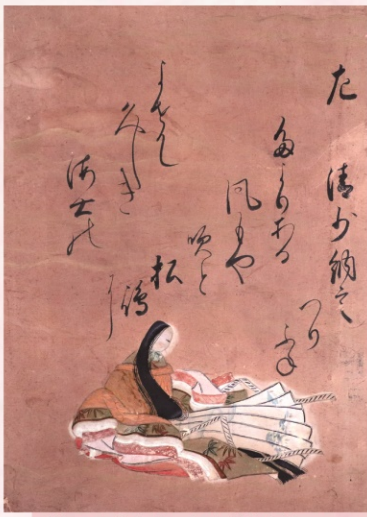
『女三十六歌仙』より「清少納言」居初つな筆（個人蔵）