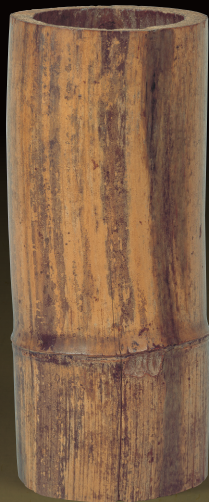
竹尺八花入 利休作 今日庵蔵 (展示期間：9月15日～10月2日)