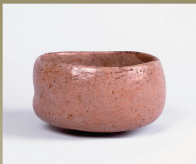
赤茶碗 銘門外不出 六代六閑斎泰叟作 今日庵蔵

茶席で使用される茶道具や書画には、歴代家元の創意を汲んで職人が制作したものや、本来別の用途があったものを茶道具に見立てたものなどがあります。とりわけ心のおもむくままに作られた手造りの茶道具には、その人ならではの好みや趣向がおのずから表出しています。利休以来、歴代の手によって生み出された茶道具や書画から、茶の理念を探るとともに、裏千家の歴史をたどる展観とします。