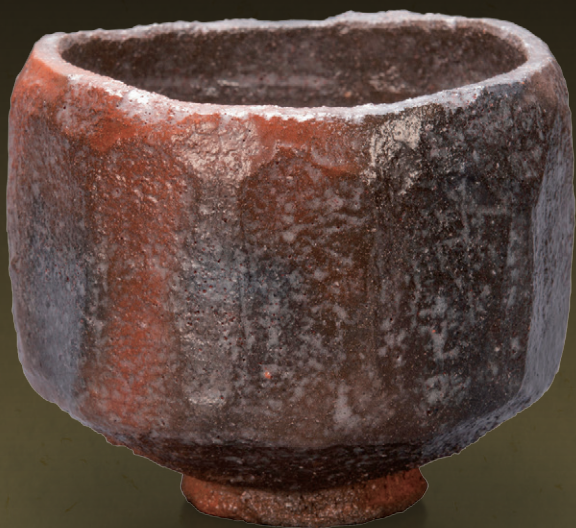
赤茶碗 銘且緩緩 十六代坐忘斎作 今日庵蔵

開館時間=午前9時30分～午後4時30分(入館は午後4時まで) / 休館日=月曜日(但し、祝日は開館。翌日休館)、第2・4火曜日、展示替え期間(10月24日・25日) 入館料=一般1,000円、大学生600円、中高生350円、小学生以下ならびにメンバーシップ校の方は無料 呈茶=一般500円、小学生以下300円(要別途入館料) 学生証提示により300円 平日と一部土・日・祝日に開催