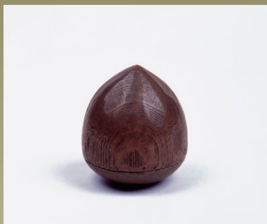
椰子形香合 五代不休斎常叟作 四代仙叟在判 今日庵蔵