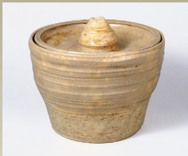
つぼつぼ形撮水指 十代認得斎柏叟作 今日庵蔵