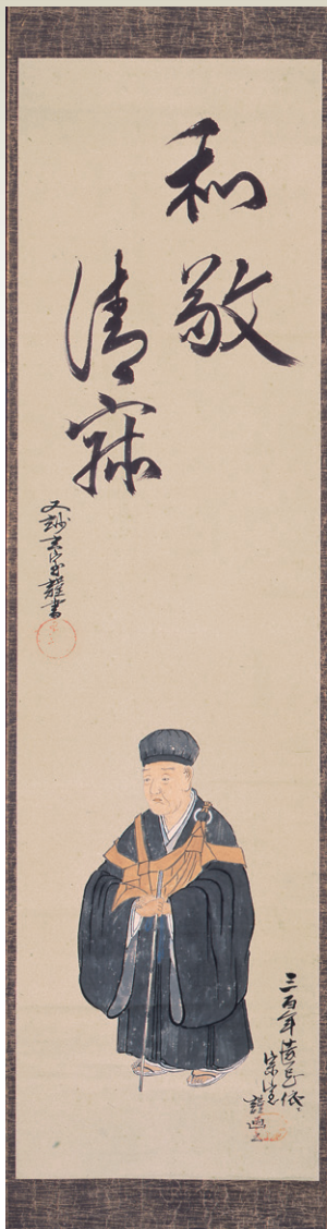
利休居士画賛 十二代又妙斎直叟・十三代円能斎鉄中合筆 今日庵蔵 (後期展示)