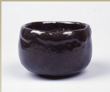
黒茶碗 銘延年 九代不見斎石翁作 今日庵蔵 (後期展示)