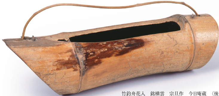
竹釣舟花入 銘横雲 宗旦作 今日庵蔵 (後期展示)