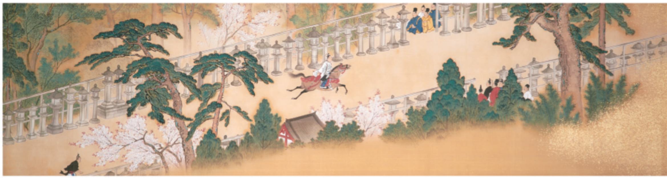
原在明 筆「石清水臨時祭礼図巻」上巻(部分)(徳川美術館 蔵) 前期(～11月6日)展示