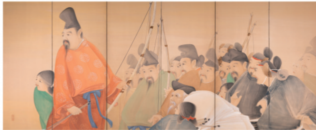
都路華香 筆「弓鏡べ」(鉄斎堂 蔵)

生駒山系の北端、京の都を南西から見守る男山の頂上に位置する石清水八幡宮。創建以来、篤い信仰が寄せられています。武家とのゆかりも深く、平安時代、源義家(1039～1106)は石清水八幡宮で元服し「八幡太郎」と称しました。源氏の氏神として尊ばれ、鎌倉の鶴岡八幡宮創建も、石清水八幡宮より勧請されたことに始まります。展覧会では、鎌倉幕府2代執権・北条義時の花押のある「関東下知状」(重要文化財、石清水八幡宮蔵)を特別公開(～11月6日)させていただきます。鎌倉と八幡のゆかりに思いをはせて頂けましたら幸いです。 武芸をつかさどる弓矢とのかかわりも深い石清水八幡宮。境内には継(月)弓岡という地名も残ります。展覧会では、江戸時代初期の石清水八幡宮の文人僧・松花堂昭乗が、平安時代の弓矢の名人・源為朝を描いた「鎮西八郎為朝像」(松花堂美術館蔵)、同じく昭乗が中国の弓の名人・羿を描いた「羿図」(大宝院蔵)を中心に、弓をめぐる作品もご紹介します。京都八幡で、平安・鎌倉・江戸時代の時と空間にふれて頂けましたら幸いです。