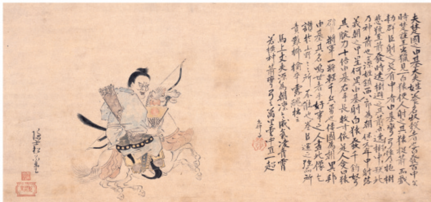
松花堂昭乗 筆「鎮西八郎為朝像」(松花堂美術館 蔵)