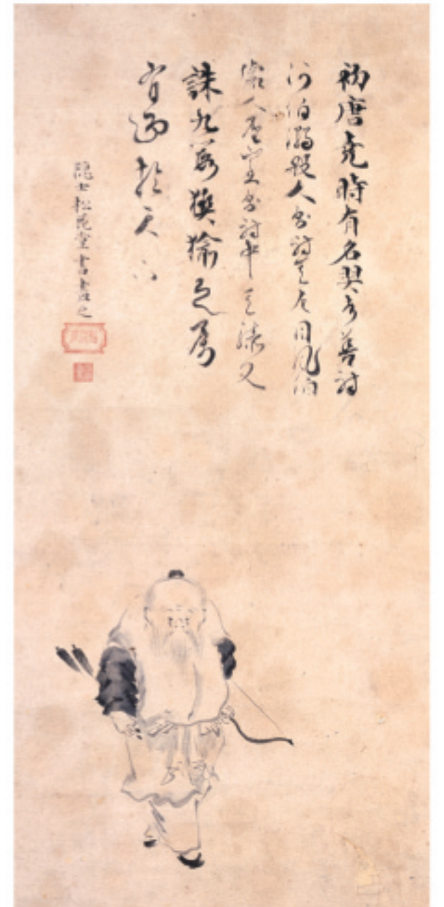
松花堂昭乗 筆「羿図」(大宝院 蔵)